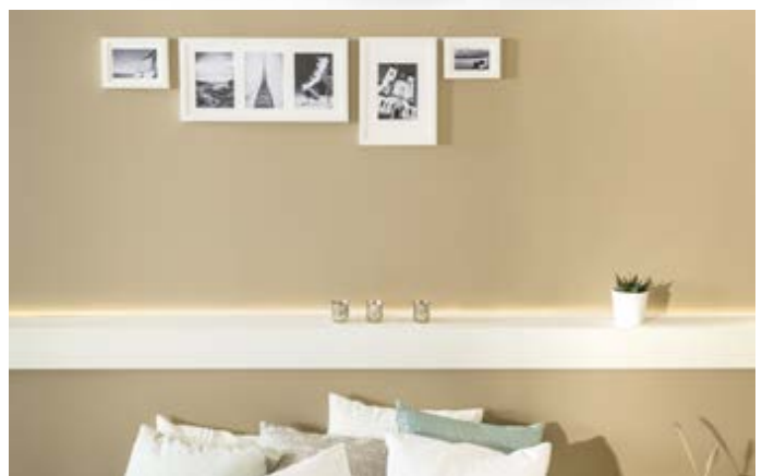
ARSTYL® WALL TILES