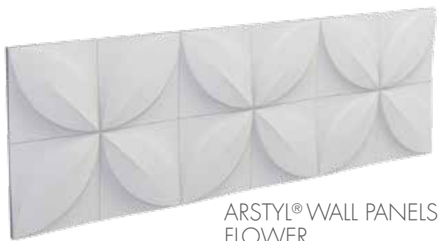
ARSTYL® WALL PANELS FLOWER

Les panneaux muraux ARSTYL® WALL PANELS FLOWER de NMC permettent de placer des éléments décoratifs précis dans l'espace. Le panneau tridimensionnel convient surtout pour créer un jeu d'ombres et de lumières à la fois vivant et subtil.